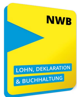
NWB Lohn Deklaration & Buchhaltung